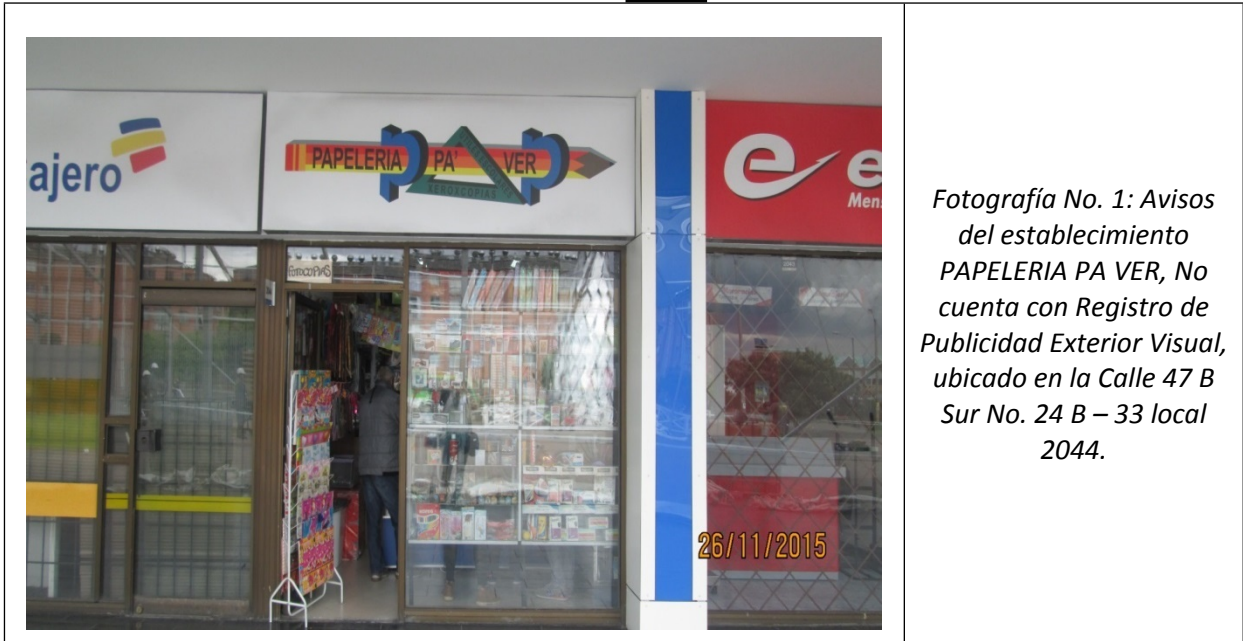
Fotografía No. 1: Avisos del establecimiento PAPELERIA PA VER, No cuenta con Registro de Publicidad Exterior Visual, ubicado en la Calle 47 B Sur No. 24 B – 33 local 2044.